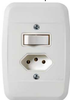
Figura 5 - Interruptor/tomada

CONDUTORES: Para os condutores de alimentação do Quadro de distribuição deverão ser utilizados preferencialmente, condutores singelos, com isolação em EPR para 0,6/1KV. Nas demais instalações, serão utilizados condutores com isolação 450/750V. Qualquer tipo de condutor enterrado, independente do circuito, deverá ser isolado para 1kV. Os fios e/ou cabos elétricos de qualquer seção, deverão ter seus isolamentos nas seguintes cores: