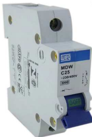
Figura 6 - Disjuntor din

LUMINÁRIAS: Deverá ser utilizado painel led de sobrepor em chapa de aço tratado e pintado na cor branca, com refletor de alta refletância e alta pureza, conforme Figura 7.