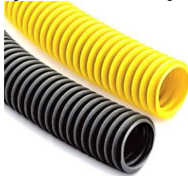
Figura 1 - Eletrodutos corrugados

ELETRODUTOS DE AÇO CARBONO: Deverão ser utilizados para a distribuição das instalações elétricas e de lógica abaixo do balcão de atendimento conforme detalhes e em projeto. Suas características devem atender a NBR 5598. O diâmetro externo mínimo para aplicação no projeto será de 20 mm. A Figura 2 apresenta o mesmo.