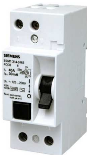
Figura 8 - Dispositivo residual

CONEXÕES: Devem ser utilizados conectores apropriados conforme as necessidades da instalação.