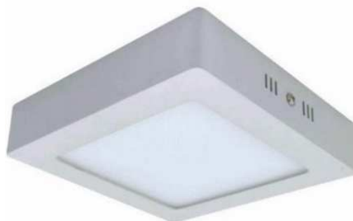
Figura 7 - Painel led

DISPOSITIVO RESIDUAL: Um disjuntor diferencial, ou disjuntor diferencial residual (DR), é um dispositivo de proteção utilizado em instalações eléctricas, permitindo desligar um circuito sempre que seja detectada uma corrente de fuga superior ao valor nominal. Os DR's devem atender a certificação INMETRO e possuir sensibilidade de 30 mA para a proteção contra choques eléctricos conforme modelo da Figura 8.