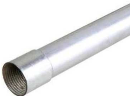
Figura 2 - Eletroduto aço carbono

CAIXAS CONDULETE: Serão em alumínio com alta resistência mecânica e de corrosão. Seu tamanho deve ser compatível com a bitola dos eletrodutos especificados em projeto. A Figura 3 apresenta as caixas e seus respectivos modelos. No projeto foram utilizados os modelos C, LL e B.